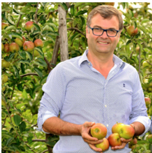
Buttiens Fruits Grand Route, 56 4537 VERLAINE infos@buttiens-fruits.com