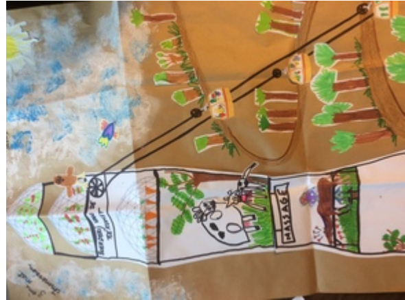
Ecole Sainte-Begge 3 (maternelles immersion) Rue Saint Maurice, 101 5300 SCLAYN