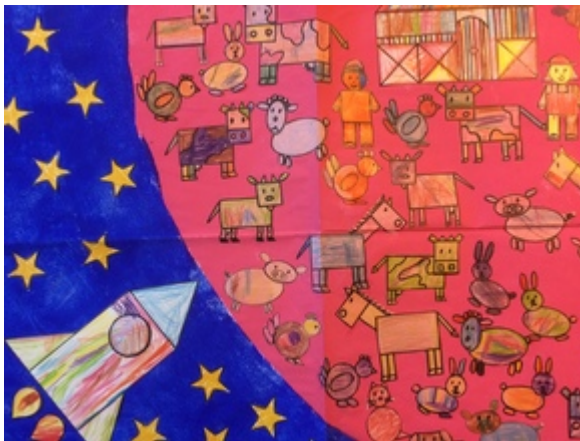
Ecole Saint Remacle Madame Bernadette (maternelles) Rue Saint Remacle, 33 4800 VERVIERS