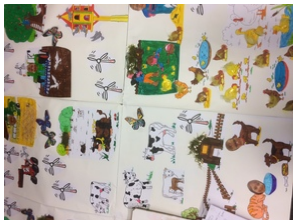
Ecole communale de Chiny Madame Sylviane (primaires) Rue de Corbuha, 14 6810 CHINY