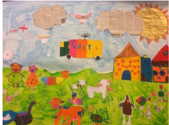
Ecole de Sart Madame Halleux (primaires) Rue de l'Ecole, 10 4845 SART