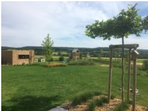
Clément Furdelle - Jemelle