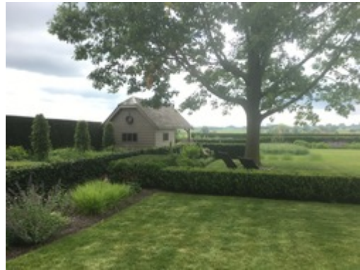
de Breuck-Demeyere - Arc-Ainières